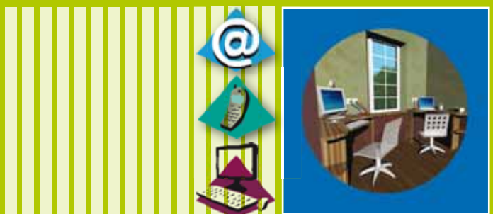
Internet, visioconférence, visiophonie et vidéosurveillance

Le réseau VDI unifie tous les besoins relatifs au transport voix, données, images.